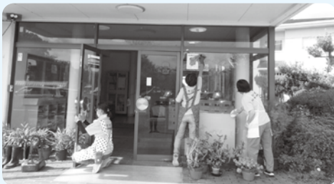
香翠寮での作業奉仕

9月19日(木)、香翠寮に市川町民生委員児童委員協議会の方々、奉仕活動に来てくださいました。