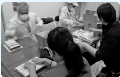
いちかわ園での作業奉仕